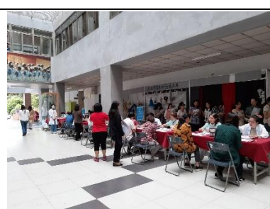
108 年 全校教職員健康檢查