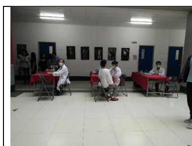
107 年 全校教職員健康檢查